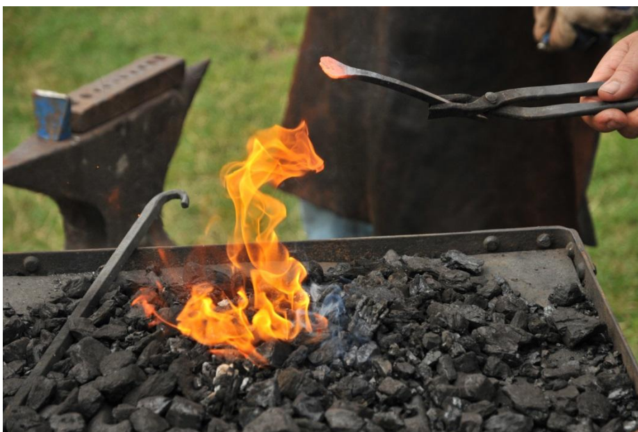
Smeder på Jädersbruksdagarna!