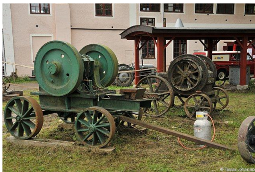
Skärmtaket vid stenkrossen blev färdigt