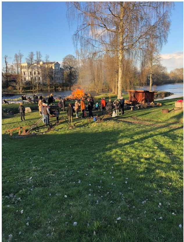
Snart är våren här igen!