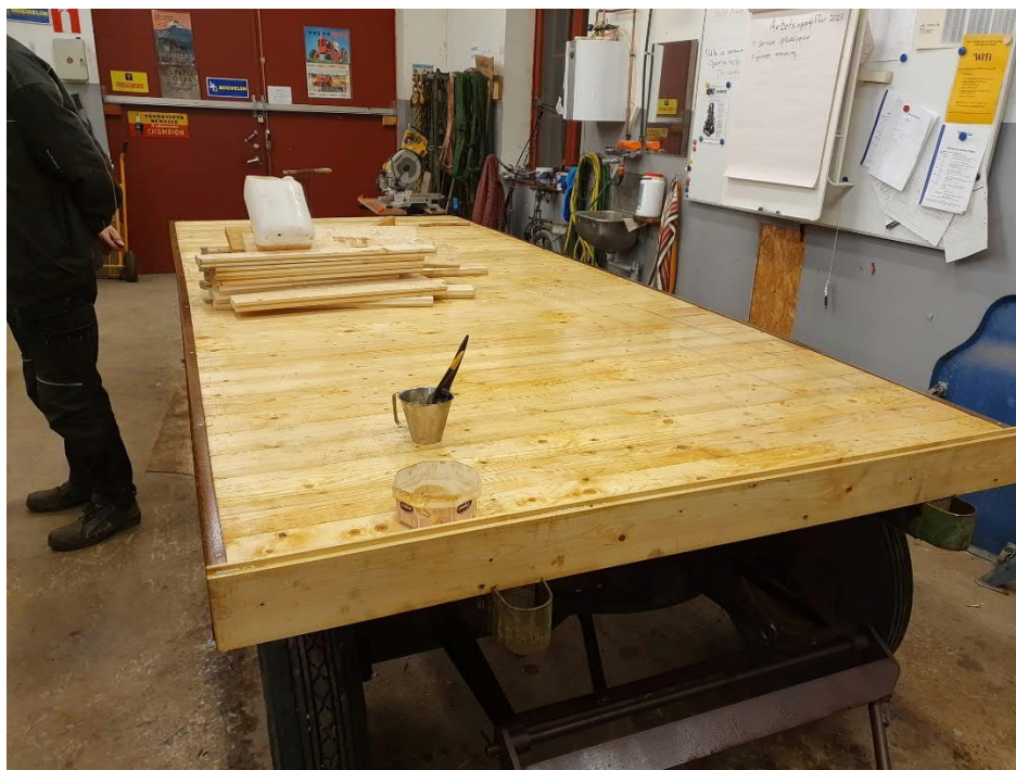
En gammal flakvagn får nytt liv, tack tisdagsdrängarna!

Valborgsfirande 30/4 med bra uppslutning, vi ser ett trendbrott där flera nya ansikten dyker upp vid brasan, mycket kull!