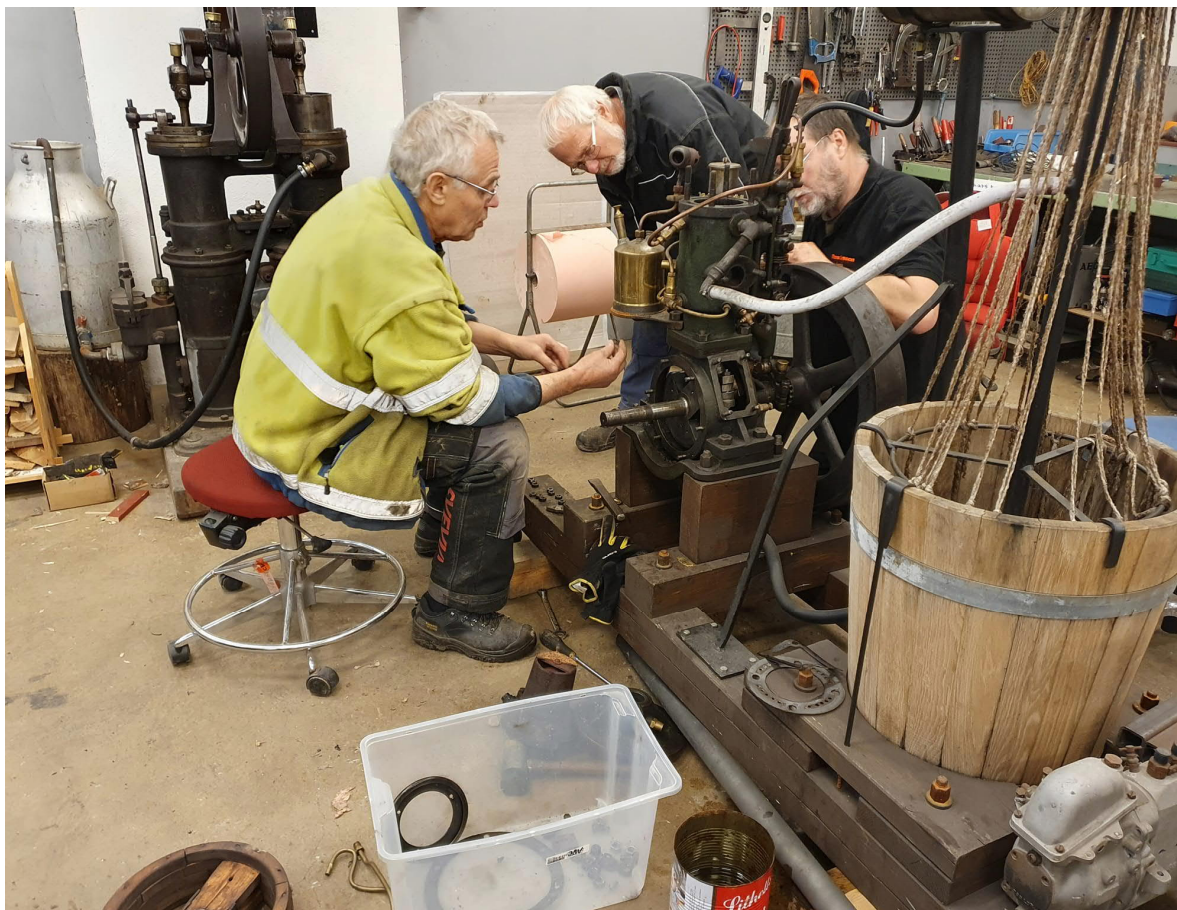
En gammal Råoljemotor får översyn av kunniga drängar

Vi är i särskilt stort behov av någon eller några som vill förstärka vår historiegrupp som fått rejält med luft under vingarna. Hör av dig till Staffan Brundin tfn. 070-632 42 62 om du vill vara med i detta härliga gäng