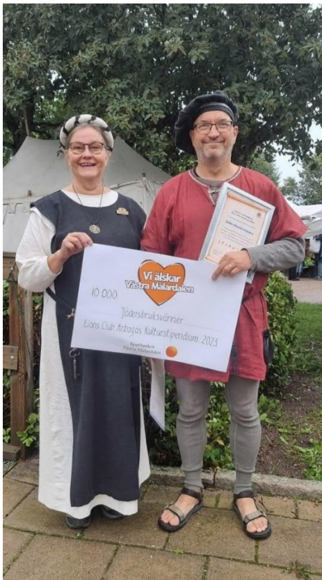
Tack Lions för Kulturstipendium